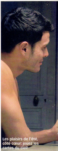
Les plaisirs de l'été, côté cœur: jouez les cartes du ciel!

A côté de son émission quotidienne sur Radio Monte-Carlo ( Lahaie, l'amour et vous ), elle se passionne pour l'astrologie. Elle a sorti plusieurs livres sur le sujet, dont un Osez... le sexe selon les astres , petit guide sexorigolo des Editions La Musardine, qui devrait vous accompagner cet été.